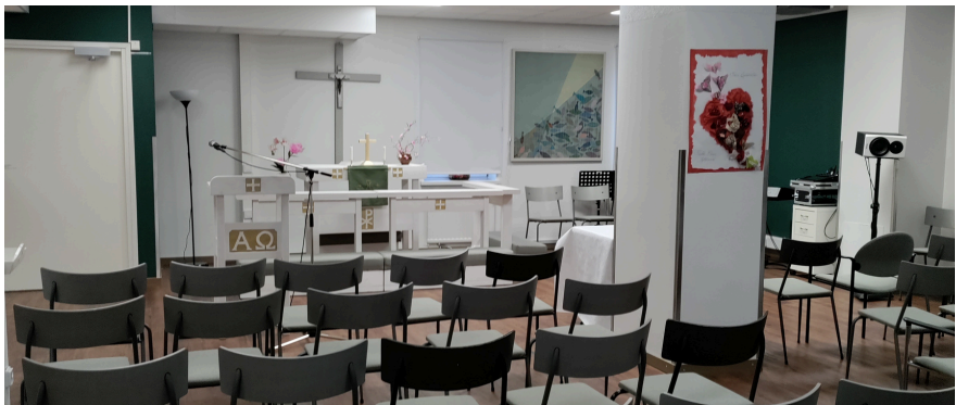
Kuva Kouvolan Toimintakeskus Kohtaamispaikasta

Uskonelämän peruspilarit, Opetus: Leif Nummela. musiikki: Tikvah